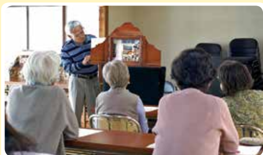
窓から見えるのは....