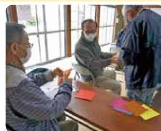
助け合いながら完成を目指します。