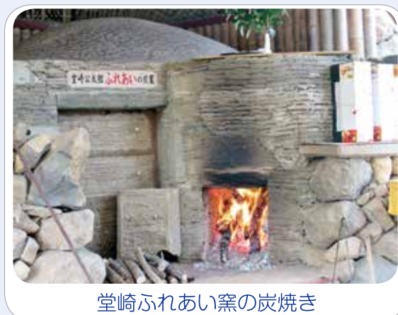
堂崎ふれあい窯の炭焼き