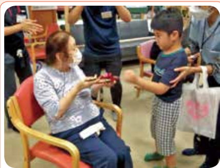
くれよんのこども達との交流風景