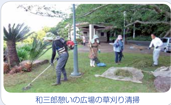
和三郎憩いの広場の草刈り清掃

そして事業を推進していく上で最も重要なことは、協力者の立場を明確にしておくことです。そのため“NPO 法人 堂崎の環境を守る会”を発足し、その会員として活動していただいています。また、「花苗の植付け」および「お茶づくり」は、保育園児の学習の場にもなっています。