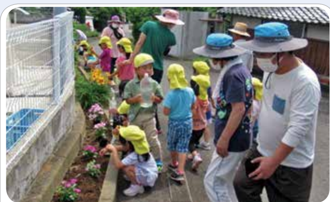
花壇への花苗の植付け